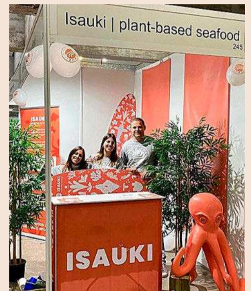
Equipo de Isauki, firma fundada por Milos Dukat.

las anillas de calamar plant based , enfocados a los consumidores veganos, al público flexitariano con interés en incorporar nuevas opciones vegetales a su dieta y a aquellas personas que tienen alergias e intolerancias", explican en Isauki. Uno de sus valores diferenciales es la apuesta por la investigación continua para el desarrollo de nuevas texturas y sabores. Según cifras de Isauki, la elaboración de sus productos a partir de algas marinas permite la reducción de entre un 30% y un 50% de la destrucción del fondo marino por una pesca excesiva.