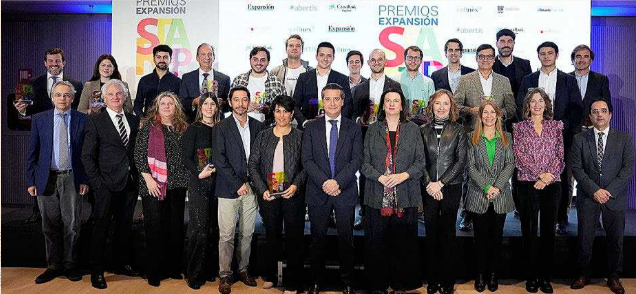
Foto de familia de premiados, patrocinadores y colaboradores de la quinta edición de los Premios EXPANSIÓN Start Up, el pasado miércoles.