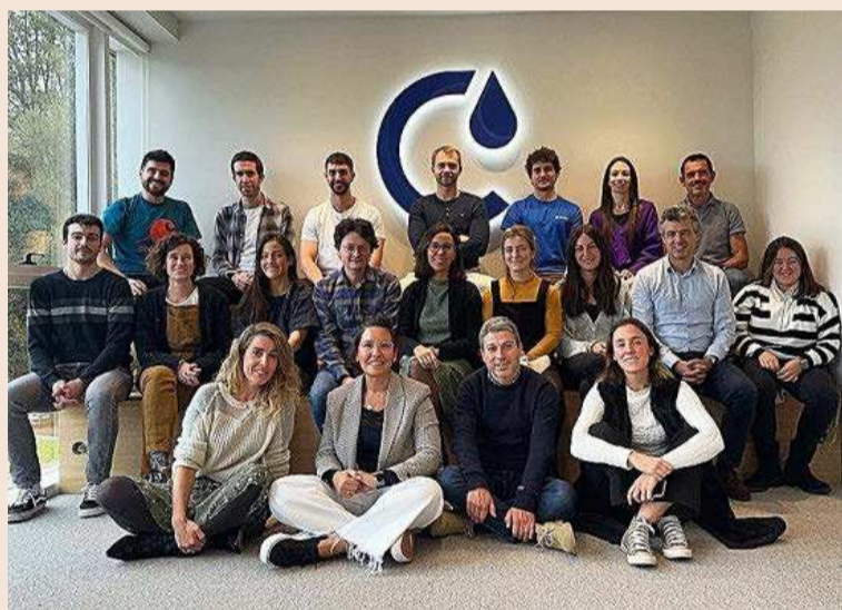
Equipo de Cimico.