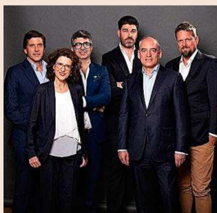
Equipo fundador de Build to Zero.

calor industrial electrificando con energía renovables, mediante una solución que combina el power to heat con el almacenamiento térmico; proporcionar servicios de flexibilidad a la red eléctrica; y eliminar el vertido de generación renovable, ampliando el tamaño de las instalaciones de autoconsumo. Cerró 2022 con una facturación de 60.000 euros. La previsión para 2023 es de 850.000 euros.