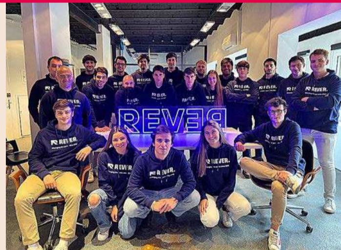
Equipo de Rever.

Mundi Ventures, Barlon Capital y Sequoia, además de otros inversores nacionales e internacionales como Wayra, el hub de innovación de Telefónica. “Nuestra propuesta se basa en una solución B2B SaaS súper escalable que permite solicitar una devolución en tan solo dos clics y obtener el reembolso en 24 horas”, explican desde la start up .