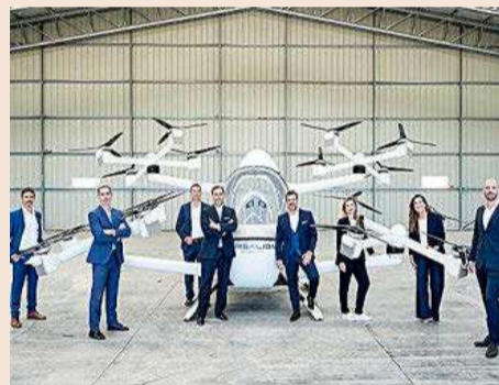
Miembros del comité ejecutivo de Crisalion Mobility con uno de los vehículos aéreos de la empresa.

Crisalion Mobility , la antigua Umiles Next, apuesta fuerte por la movilidad aérea y terrestre. Sus promotores están convencidos de que en 2030 las aeronaves eléctricas estarán presentes de forma habitual en trayectos urbanos y regionales y recuerdan que ya existen experiencias de movilidad terrestre autónoma teledirigidas desde un centro de control como la que ellos han desarrollado. La empresa ha llevado a cabo pruebas de vuelo en