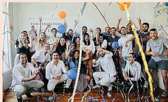
Equipo de Brickbro.

minimizar riesgos a cualquier persona interesada en abrir, expandir su negocio o invertir en locales. La compañía utiliza la IA para rastrear la normativa urbanística de cada ciudad y los requisitos de cada licencia de actividad, definiendo qué usos y actividades se pueden desarrollar en cada local. Brickbro tiene una cartera de más de 1.350 locales disponibles, valorados en 270 millones de euros.