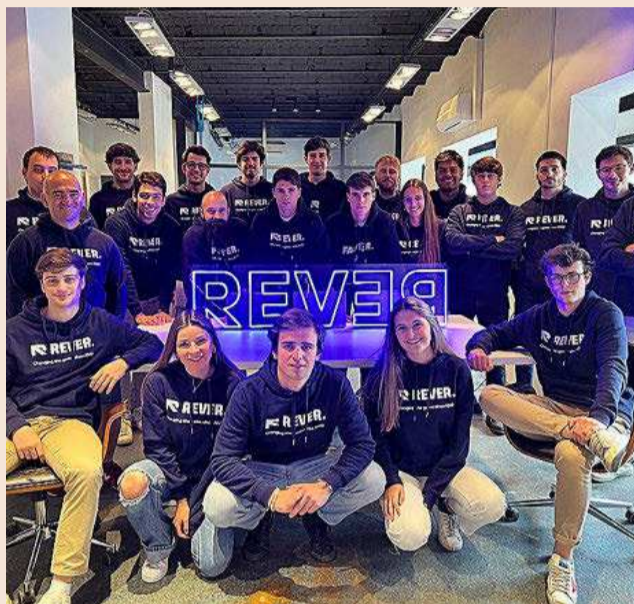
Equipo de Rever.